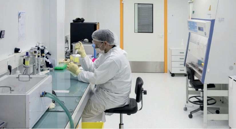
Un laboratoire de culture cellulaire à MIRCent (Molecular Imaging Research Center)