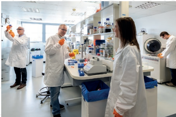
Un laboratoire de biochimie à MIRCent

Ces portes ouvertes s'adressent au grand public intéressé par les sciences et aux citoyens concernés par les grands enjeux que sont la santé et l'énergie.